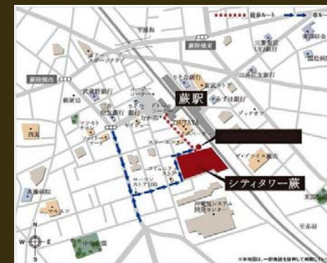
ゼンリン住宅地図「川口・蕨」西部版<P47 B1>

駐車場 / **000円 →タワー式(車種制限あり) 保険 / 15,000円(2年) 条件 / 保証会社加入 特約 / 室内禁煙・ペット不可 入居 / 即