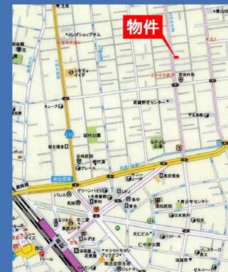
ゼンリン住宅地図「川口・蕨」西部版<P30 G4>