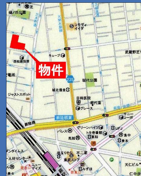
ゼンリン住宅地図「川口・蕨」西部版<P29 J5>

※鍵は現地対応になっておりますので内見の際はお気軽にお問合せ下さい。 ※退去時にはルームクリーニング費用をご負担していただきます。 ※更新時、更新料1ヶ月、更新手数料0.25ヶ月がかかります。 ※引落手数料、月額150円がかかります。