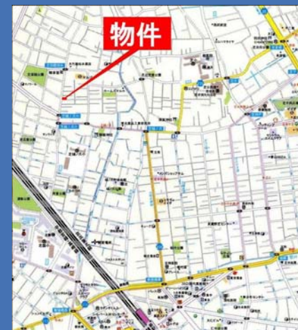
ゼンリン住宅地図「川口・蕨」西部版<P29 G1>